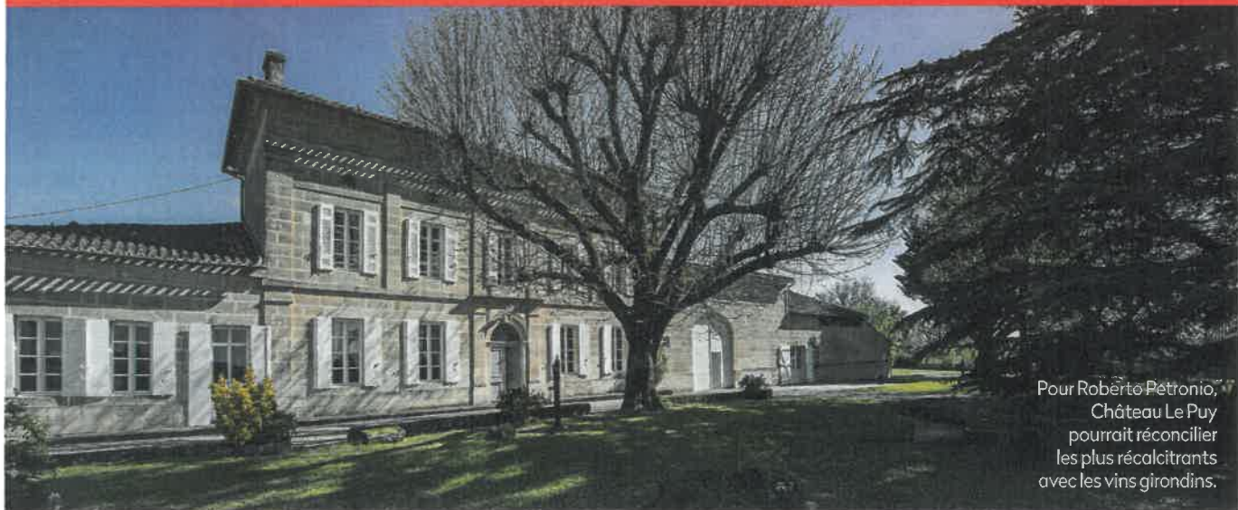
Pour Roberto Petronio, Château Le Puy pourrait réconcilier les plus récalcitrants avec les vins girondins.