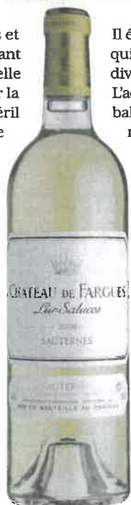
Fargues : sa production relève de l'orfèvrerie.

Doisy-Daëne, propriété de Barsac voisine de Climens, appartient à la famille Dubourdiou qui y élabore des vins toujours fins et précis. À côté de la cuvée classique, à dominante de sémillon, L'Extravagant n'est produit que dans les meilleurs millésimes, issu d'une trie beaucoup plus riche, souvent plus tardive, de raisins pleinement botrytisés, avec souvent une proportion de sauvignon plus importante dans l'assemblage. Ce 2002 est frappant par son caractère très suave, empreint d'une grande fraîcheur, avec un botrytis subtil et très fin.