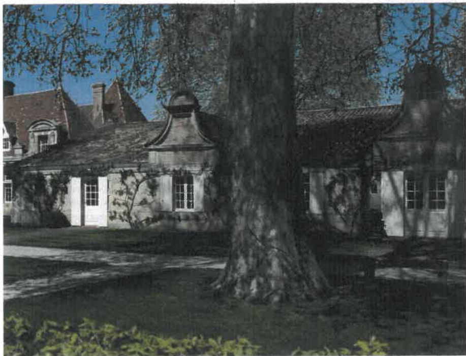
Souvent occulté par le mythique 1982, le millésime 1983 du château Rauzan-Ségla, deuxième cru classé de Margaux, mérite d'être redécouvert. Et pas uniquement à la Saint-Valentin !

dégustation à l'aveugle. Une dizaine de grands noms du vignoble français, mais parmi eux, le Château Margaux m'avait frappé, sans savoir ce que je buvais ! Ce vin qui avait évolué pendant une vingtaine d'années m'a fait découvrir des notes d'encens, de mine de crayon que je n'avais jusque-là jamais croisées : une révélation ! J'ai alors observé les dégustateurs avertis ; très vite, ils ont reconnu la patte élégante de ce château, mais les hésitations portaient sur le millésime.