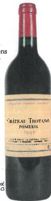
Trotanoy 1994 : une gourmandise splendide.