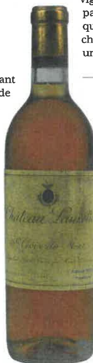
Un liqueux d'une immense complexité.

Je n'ai pas retenu le millésime. Qu'importe, car j'ai encore en mémoire la douceur et la franchise de son fruit. Un bordeaux délicieux, précis, sans artefact, sans barrique outrancière et sans tanins racoleurs. Juste un fruit d'une douceur sereine. Un vin équilibré, juteux à souhait, au caractère atlantique affirmé, un bordeaux qui réconcilierait les plus récalcitrants avec les vins girondins. Un rouge intense et digeste transpirant l'âme vigneronne comme je les aime. Il fait partie de ces magnifiques vins de soif qui me procurent un plaisir immense à chaque fois que j'ai l'occasion d'en boire une bouteille en bonne compagnie. R. P.