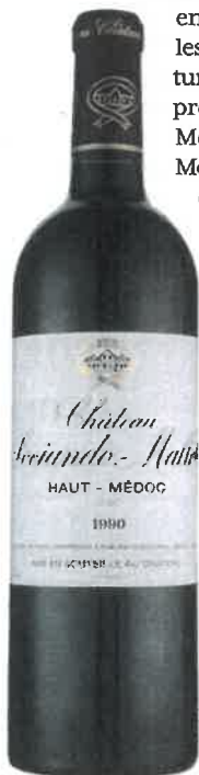
Une valeur sûre que tout amateur doit avoir en cave.