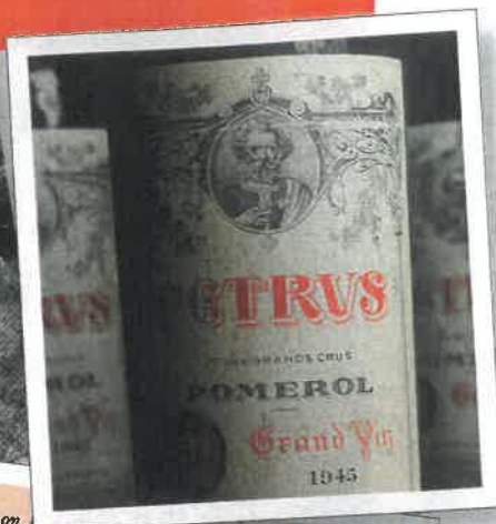
55. - PAULLAC. - Château Pichon

de vendanges Château Montrose des années 60.