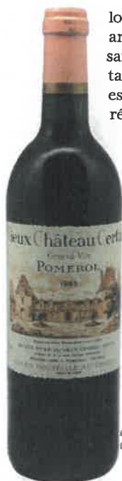
Un vin envoûtant dans un millésime réputé faible.

J'ai récemment coanimé une soirée à Bruxelles pour une centaine de convives