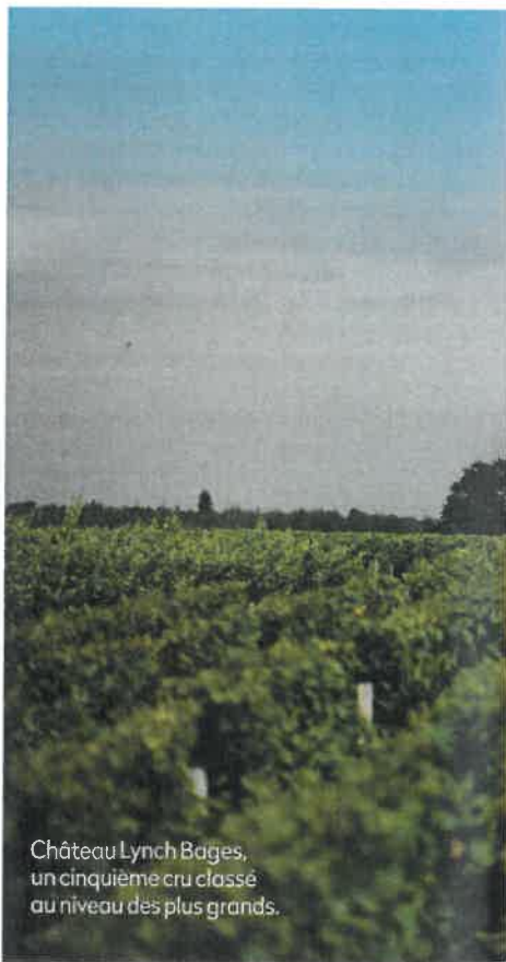
Château Lynch Bages, un cinquième cru classé au niveau des plus grands.

Il y a quelques années de cela, alors que je déambule dans les rues du vieux Bordeaux avec un ami restaurateur, nous tombons nez