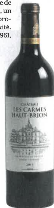
Les Carmes Haut-Brion 2013, éclatant et juteux.

C'était au printemps 2014, le temps était humide et sombre, j'allais déguster les vins premiers 2013 de Bordeaux. Au fil