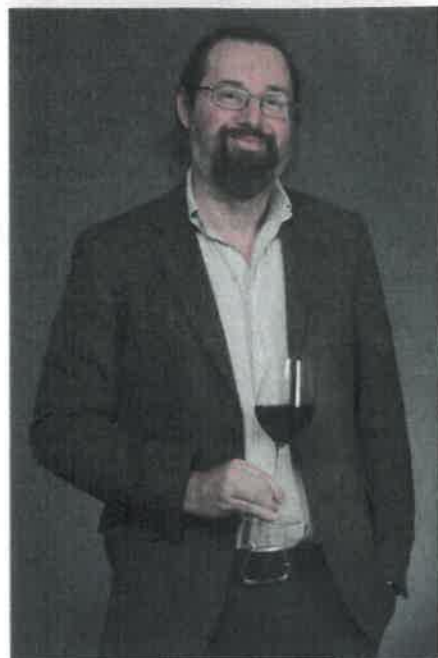
Au milieu d'une verticale de Figeac, le millésime 1971 « brillait de mille feux » selon Pierre Citerne.

Ce vin extraordinaire parvient à mettre sous l'éteignoir le sublime 1982 qui le précédait. Que possède-t-il de plus que les autres ? C'est le millésime de Pierre Desproges ! « J'avais commandé un Figeac 1971, mon saint-émilion préféré. Introuvable. Sublime. Rouge et doré comme peu de couchers de soleil. Profond comme un la mineur de contrebasse. Éclatant en orgasme au soleil. Plus long en bouche qu'un final de Verdi. Un vin si grand que Dieu existe à sa seule vue. » Difficile d'imaginer plus somptueuse description ; inclinons-nous ! Elle est tirée de L'Aquaphile, saynète des Chroniques de la haine ordinaire où le narrateur déjeune avec une commensale possédant toutes les qualités jusqu'au moment où elle versa de l'eau dans le divin breuvage.