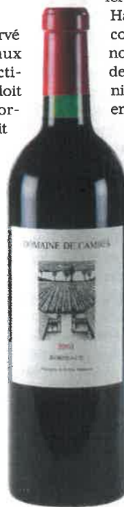
Domaine de Cambes : singulier et convaincant.