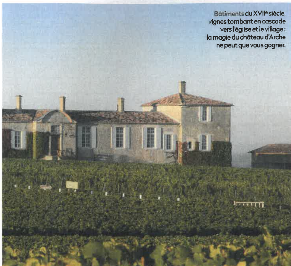
Bâtiments du XVII e siècle, vignes tombant en cascade vers l'église et le village : la magie du château d'Arche ne peut que vous gagner.

sucres, quelle richesse de saveurs et d'arômes ! C'est le cas de L'Extravagant de Doisy-Daëne, une exceptionnelle cuvée que je rétiens pour illustrer la grandeur de ce chef-d'œuvre en péril qu'est Sauternes. Buily a trois ans, ce vin s'est inscrit dans ma mémoire et a agi comme le révélateur de la variété et de la complexité des styles que les grands liquoreux bordelais peuvent offrir.